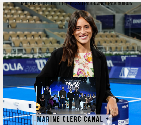
MARINE CLERC CANAL ±